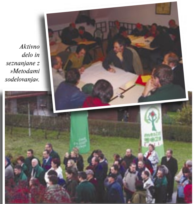
Aktivno delo in seznanjanje z »Metodami sodelovanja«.

Teme in besedila, ki so jih predavatelji predstavili na posvetovanju, so zbrana v posebnem zborniku »Participacija v gozdarskem načrtovanju«, zaključke posvetovanja bo pripravila posebna delovna skupina ter jih v kratkem objavila v Gozdarskem vestniku.