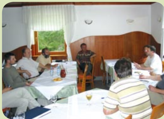
Popoldne je med udeleženci potekala sproščena, a aktivna razprava.