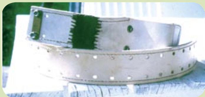
Ovratnica z radiooddajnikom za rjavega medveda, ki omogoča sledljivost osebkov.

zaključka resnega posredovanja, ki nas navdaja s posebnimi občutki - tako do medveda kot do ljudi, ki so nas poklicali in so bili zaradi tega medveda v težavah. Vedno in povsod pa vendarle ni možno uporabiti sredstev, ki bi bila za javnost prijazna. Izpostaviti velja tudi, da naše izkušnje pri odlovu in preselitvi več kot desetih medvedov oziroma medvedjih družin niso preveč spodbudne. Slovenija pač ni Kanada, ZDA ali Rusija, kjer brezmejno širjave nudijo malo možnosti za povratek teh "problematičnih" medvedov na izvorni kraj nesreče. Pri nas gre bolj za zgodbe v smislu "Lassie se vrača", ko preseljeni medvedi v nekaj dneh naredijo tudi več deset kilometrov in se vrnejo na izhodišče problema. Večino teh odlovljenih medvedov namreč opremimo z ovratnico z radiooddajnikom in spremljamo njihovo gibanje. Delo na odlovu medvedov, sposobnost ujeti medveda