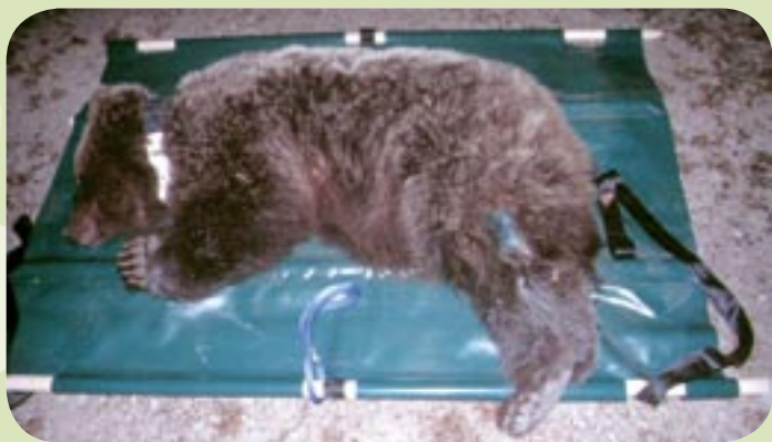
Tehtanje in izmera uspavanega medveda pred preselitvijo in izpustom.

zaključka resnega posredovanja, ki nas navdaja s posebnimi občutki - tako do medveda kot do ljudi, ki so nas poklicali in so bili zaradi tega medveda v težavah. Vedno in povsod pa vendarle ni možno uporabiti sredstev, ki bi bila za javnost prijazna. Izpostaviti velja tudi, da naše izkušnje pri odlovu in preselitvi več kot desetih medvedov oziroma medvedjih družin niso preveč spodbudne. Slovenija pač ni Kanada, ZDA ali Rusija, kjer brezmejno širjave nudijo malo možnosti za povratek teh "problematičnih" medvedov na izvorni kraj nesreče. Pri nas gre bolj za zgodbe v smislu "Lassie se vrača", ko preseljeni medvedi v nekaj dneh naredijo tudi več deset kilometrov in se vrnejo na izhodišče problema. Večino teh odlovljenih medvedov namreč opremimo z ovratnico z radiooddajnikom in spremljamo njihovo gibanje. Delo na odlovu medvedov, sposobnost ujeti medveda