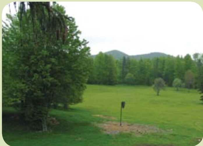
Pogled z naše opazovalnice.