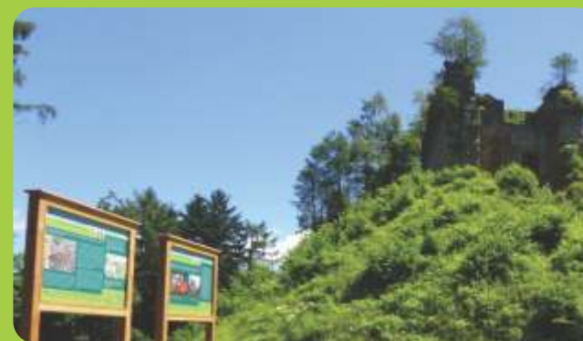
Informativni tabli pri gradu