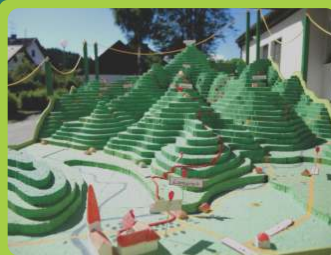
Maketa učne poti

“TISTI GRAD TAM NEKJE je bil skrivnostni grad s čarobno močjo, toda prav nihče ni vedel, kje natančno je. Kralji s celega sveta so ga želeli odkriti, saj so slišali, da se v njem skriva skrinja čarobnih moči. Tisti, ki bi jo odprl, bi prejel dar neskončnih magičnih sposobnosti in postal za vedno nepremagljiv.”