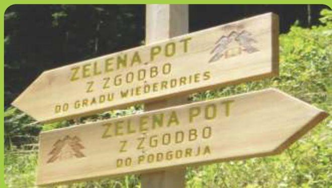
Smerokaz na poti