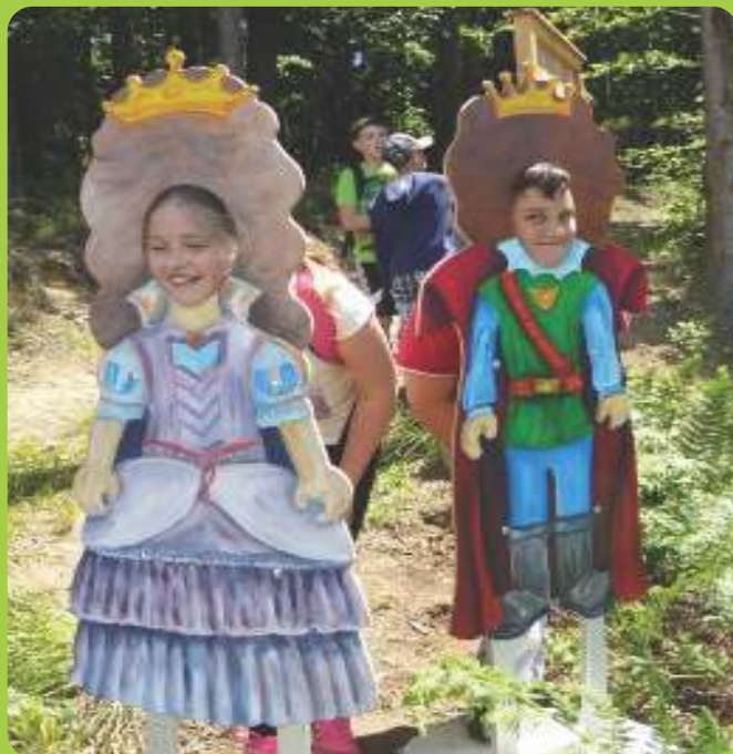
Maskoti na poti

Pogled skozi maskoto princese Veronike te bo usmeril proti Košenjaku. Vidiš lahko tudi Grad s cerkvijo sv. Pankracija in del Avstrije.